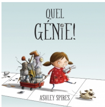
SPIRES, Ashley. Quel génie! (2014)