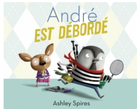
SPIRES, Ashley. André est débordé . (2016)

Consigner, dans un tableau, les observations des élèves quant au thème abordé et à la complémentarité texte-image ainsi que leurs impressions pour chacun des albums. Animer des discussions permettant aux élèves de comparer les œuvres et d'identifier des ressemblances entre elles.